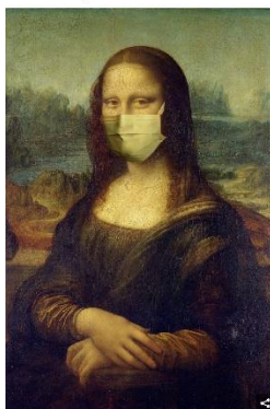
#13 Mona Lisa By Leonardo Da Vinci, 1503

Atividades adaptadas do concurso ART5 da diretoria de ensino